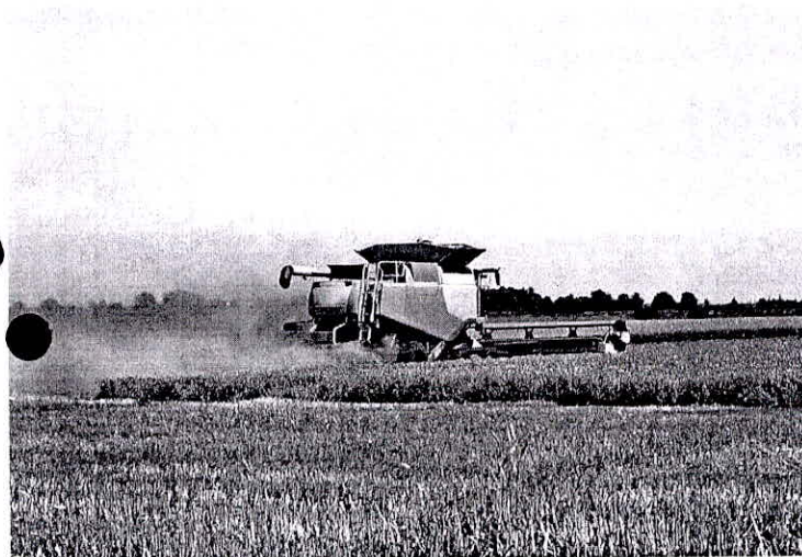
Safra será 5,2% menor que a de 2017

(Abr) O Instituto Brasileiro de Geografia e Estatística (IBGE) reduziu para 228,1 milhões de toneladas a previsão da safra nacional de cereais, leguminosas e oleaginosas deste ano. A estimativa do Levantamento Sistemático da Produção Agrícola, feita em maio, é 0,8% inferior (ou 1,9 milhão de toneladas) na comparação com a de abril.