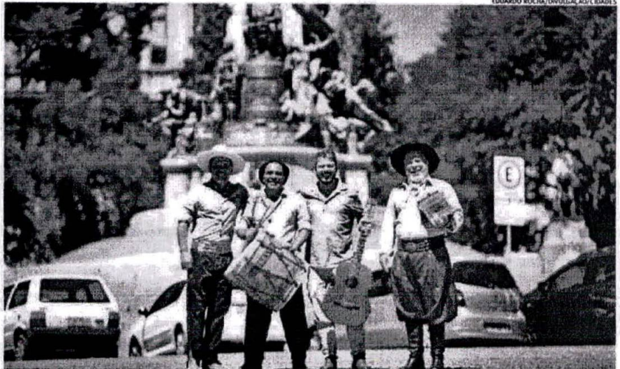
Banda musical familiar tem repertório diverso e se apresentará durante o Estação Verão Sesc

O Estação Verão Sesc traz ao calçadão de Tramandaí neste sábado (11), um show de Os Fagundes, uma das mais celebradas bandas da música gaúcha na atualidade. A apresentação terá início às 18h no palco RecreArte, unidade móvel do Sesc/RS que tem por missão levar cultura e lazer aos municípios gaúchos e estará próxima à Casa de Praia do Estação Verão, na Avenida Beira Mar. O show é gratuito e aberto ao público.