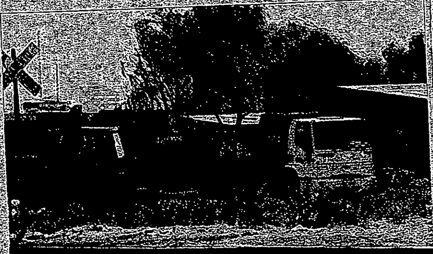
Ontem à tarde, funcionários da Prefeitura limpavam a área onde moradores tentaram invadir na última madrugada.

Al Barra Getul dores da vil ben para porto A da on le Ber o org com garan será vas u não e porto lente nova pronta