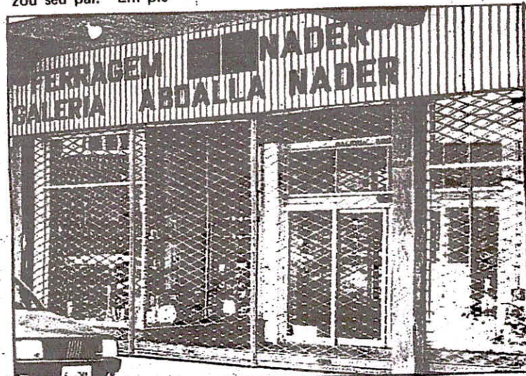
Entrada da galeria pela Marechal Floriano.