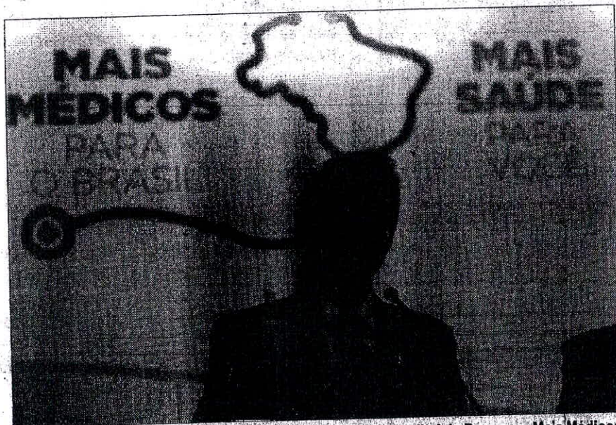
Ministro da Saúde, Arthur Chioro, divulga as regras do novo edital do Programa Mais Médicos

terior passarão por uma ambientação e começarão a trabalhar no dia 7 de julho.