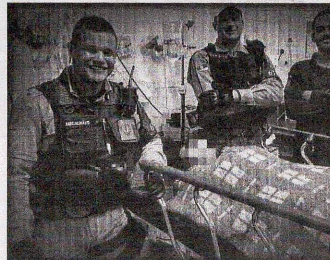
Caso ocorreu no último sábado. Encontrada e reanimada, mulher foi encaminhada para o hospital e passa bem