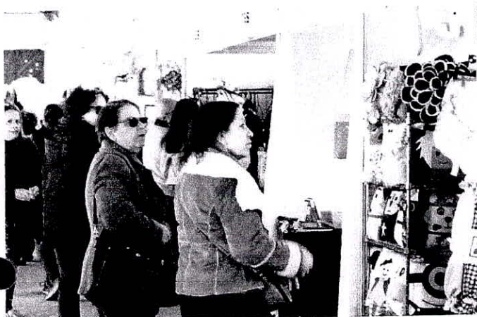
Feira acontece até 16 de julho no Centro de Eventos