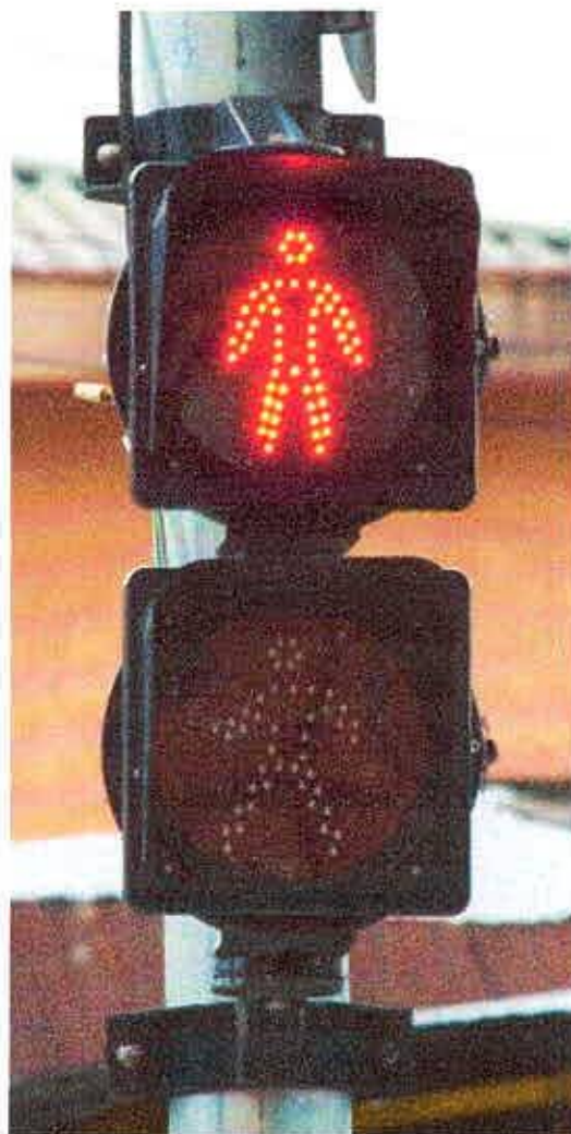
Semáforo para pedestres sem temporizador