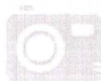
IMAGEM NÃO CADASTRADA