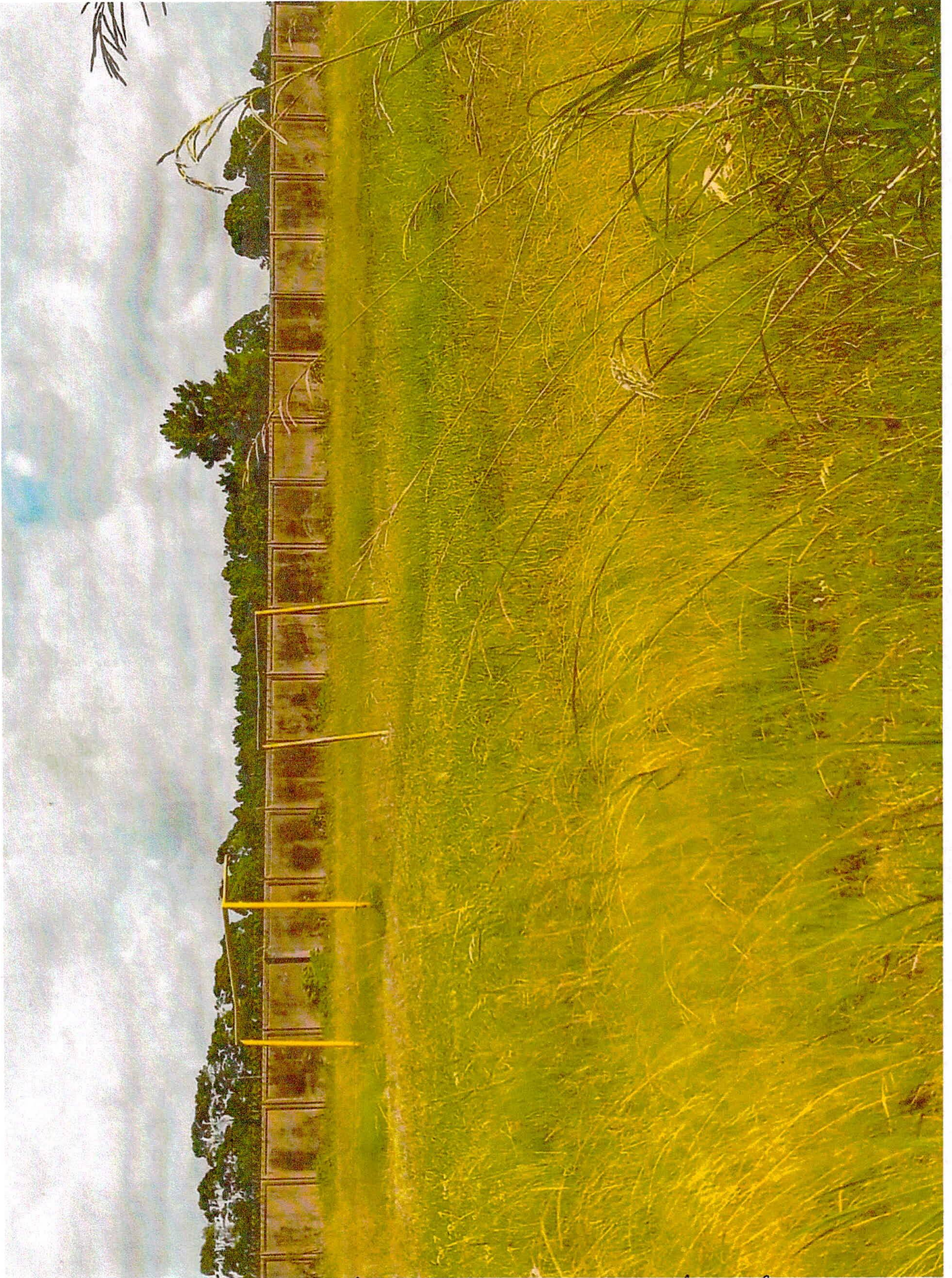
CAMP DE FULTEBOL