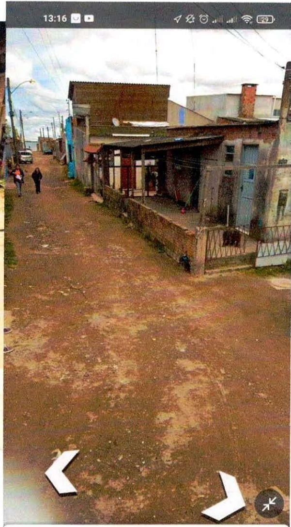
2 R. Vasco da Gama