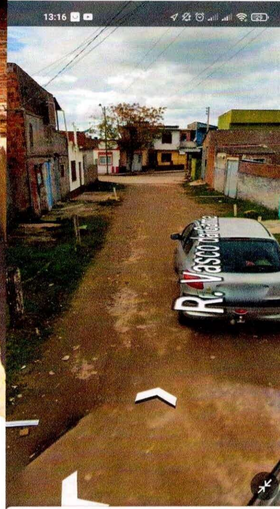
2 R. Vasco da Gama