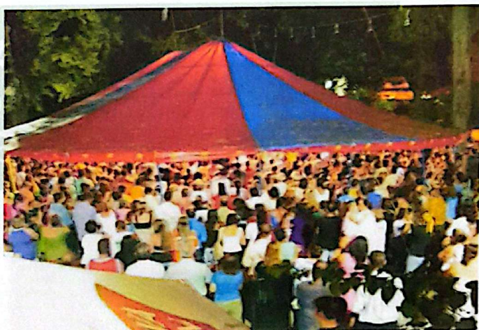
Imagens da Cruzada de Milagres – Ministério Cristo Vive

Rua General Vitorino, 441 – CEP 96200-310 – Fone: (53) 3233.8500 – Rio Grande – RS E-mail: juquinha@camarariogrande.rs.gov.br Site: www.riogrande.rs.leg.br DOE ÓRGÃOS, DOE SANGUE: SALVE VIDAS!