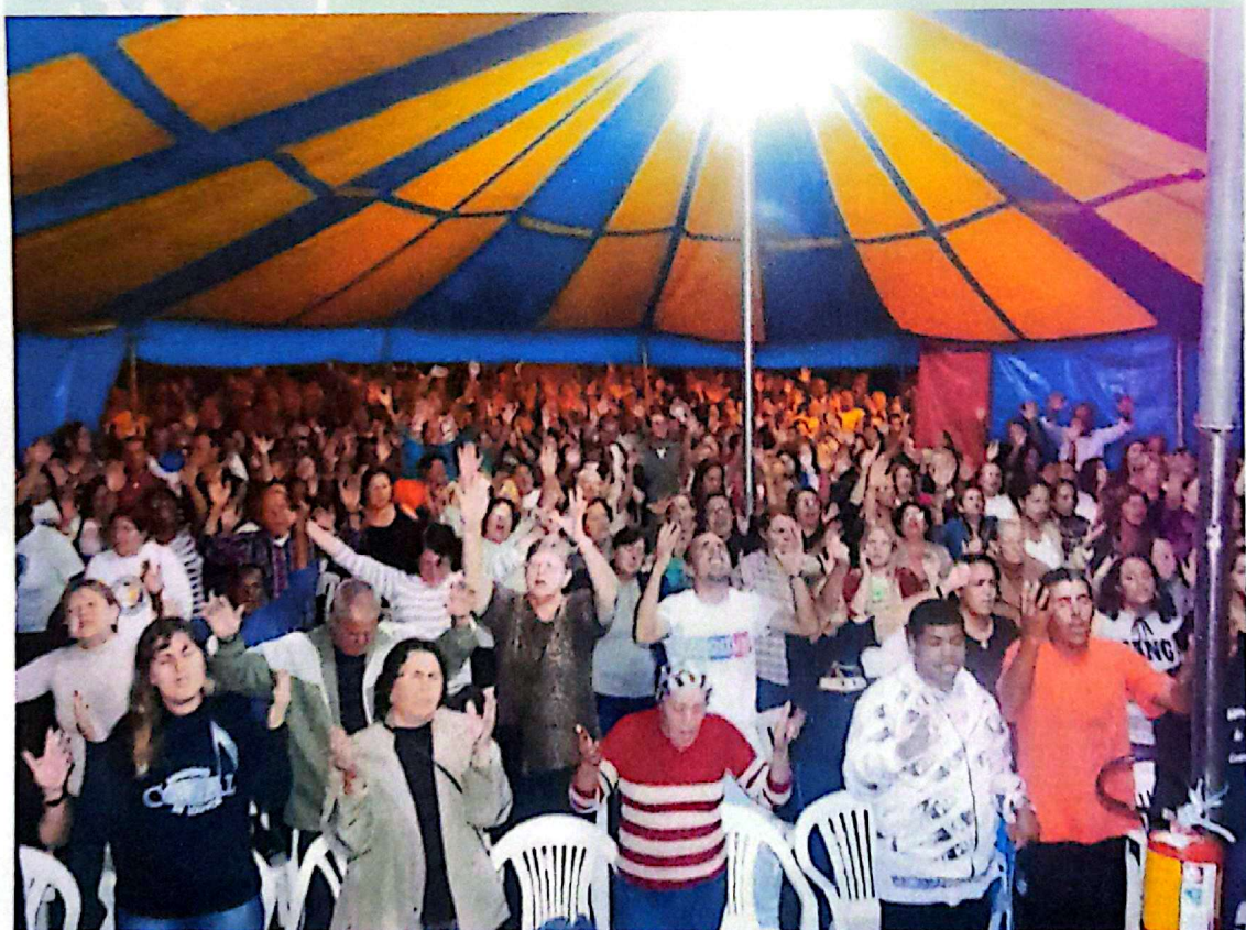
Tenda da Cruzada de Milagres – Ministério Cristo Vive

Rua General Vitorino, 441 – CEP 96200-310 – Fone: (53) 3233.8500 – Rio Grande – RS