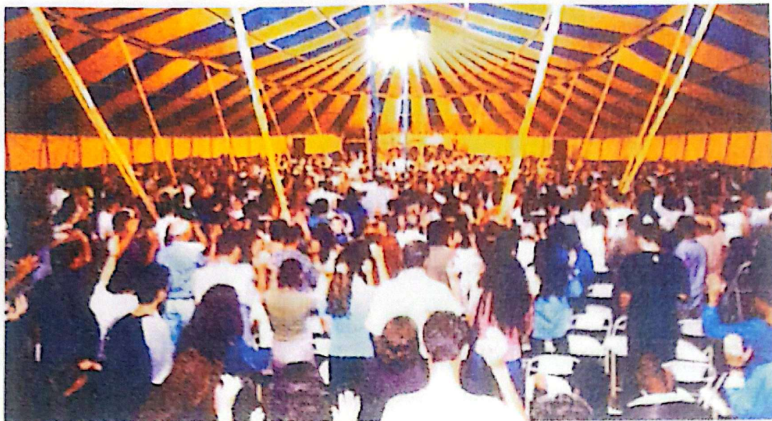
Tenda da Cruzada de Milagres – Ministério Cristo Vive