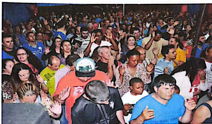
Imagens da Cruzada de Milagres – Ministério Cristo Vive